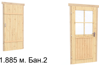
0.84×1.885 м. Бан.2 шт.