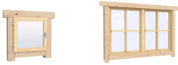
0.40×0.38 м.2 шт. 1.34×0.91 м.1 шт.