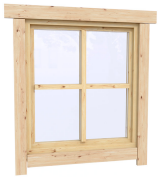
0.87×0.78 м.4 шт.