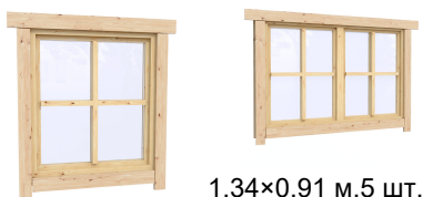
1.34×0.91 м.5 шт.