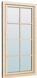
0.84×1.885 м.3 шт.