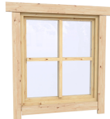
0.87×0.78 м.4 шт.