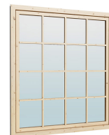
1.62×1.885 м.1 шт.